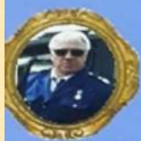
Сергей Станиславович Аксёнов