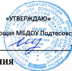
СХЕМА БЕЗОПАСНОГО МАРШРУТА ДВИЖЕНИЯ

воспитанников МБДОУ «Подтесовский детский сад № 29»